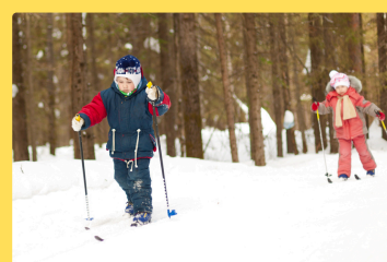
雪上アクティビティ